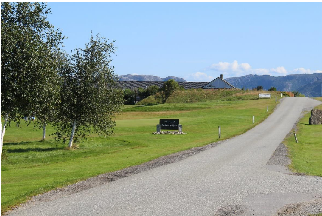
Bilde: Velkommen til Bærheim Golfpark og Sandnes Golfklubb en vakker sommerdag

Årsmøtet vedtar at medlemskontingenten er kr. 1080,- for voksen og kr. 495,- for barn og ungdom, i 2025