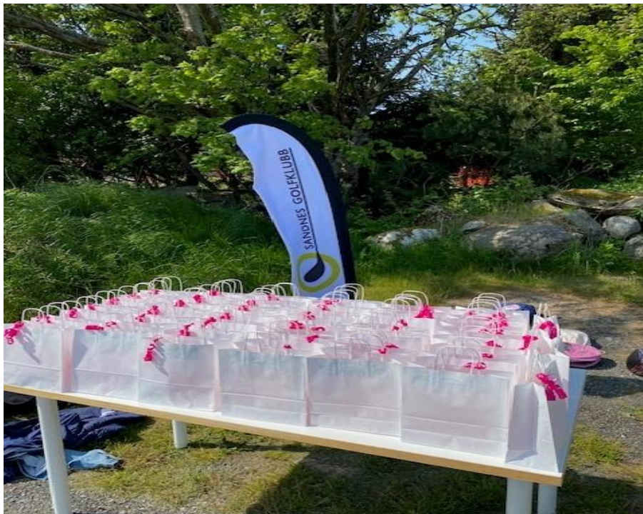
Bilde: Premiebord til jenter mellom 6-19 år. Tatt i forbindelse med Golfjentene i Rogaland arrangement 2023

Rekruttering og ivaretagelse: I 2023 gjennomførte vi Golfjentene her i klubben. Dette er tiltak for jenter som ønsker å spille golf, samt finne likesinnede i sporten. Vi skal fortsette å delta på dette tiltaket så lenge vi får mulighet. Videre så har det vært mer verving av venner til andre juniorer den siste tiden, noe som skaper premisser for at de kan bli et godt sosialt samhold i gruppene. Sommerskolen har også vært en bra arena for rekruttering, hvor vi gjennomførte en uke med golfskole med 14 deltakere.